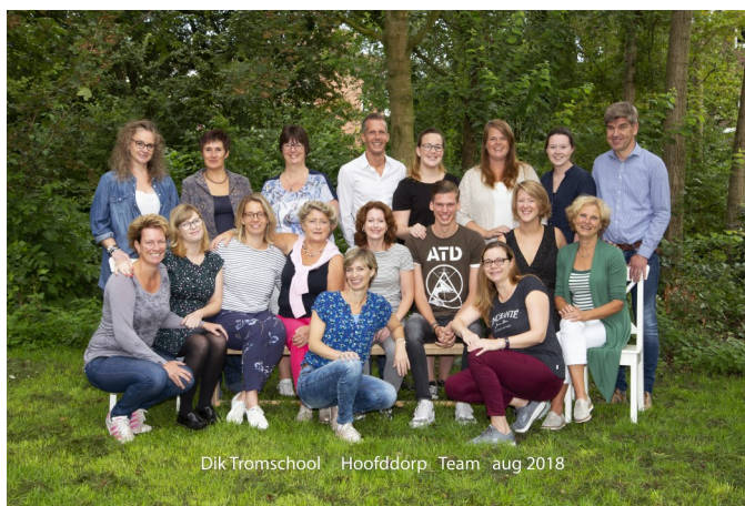
Dik Tromschool Hoofddorp Team aug 2018

Met vriendelijke groet, Het voltallige team van Dik Trom