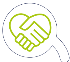
Verantwoordelijkheid / Vrijheid

De vijf pijlers die vormgeven aan ons Daltononderwijs: